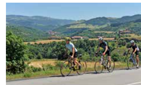
Balade à vélo en Haute-Loire

17 Cours Gervais 43170 Saugues 04 71 77 82 60 / 06 10 05 74 70 / 06 72 57 89 34 Horaires d'ouverture au public : ouvert toute l'année Distance : sur le parcours