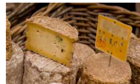
Fromages de Haute-Loire