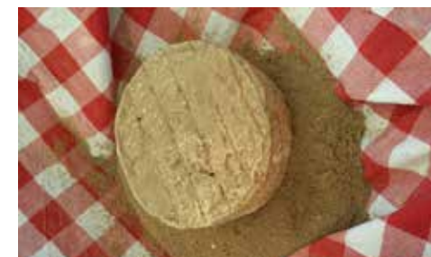
L'Artisan de Haute-Loire