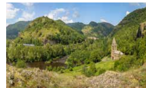
Gorges de l'Allier