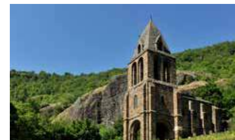
Paysages de Haute-Loire