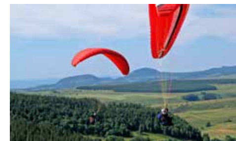
Paysages de Haute-Loire