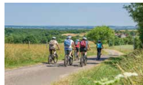
Sur les routes de l'Allier