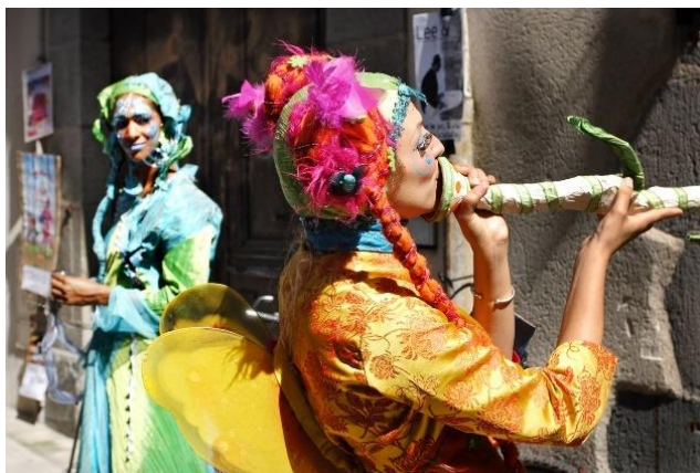
Festival international Théâtre de rue Aurillac Cantal Destination@David Frobert

- Festival des Hautes-Terres, le dernier week-end de juin à Saint-Flour.