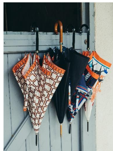
Cantal Destination@Maison Piganiol/Aurillac

PME, ETI, Start-up ou filiales de Grands Groupes, les entreprises du Cantal s'engagent pour le développement durable du territoire et le bien-être de ses salariés. Des campagnes de sensibilisation au cadre de vie se déroulent chaque année pour accueillir de nouvelles entreprises ou porteurs de projets.