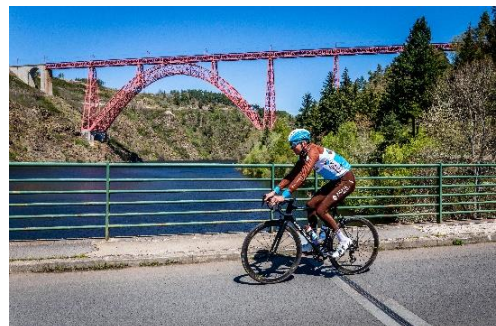
Cantal Destination