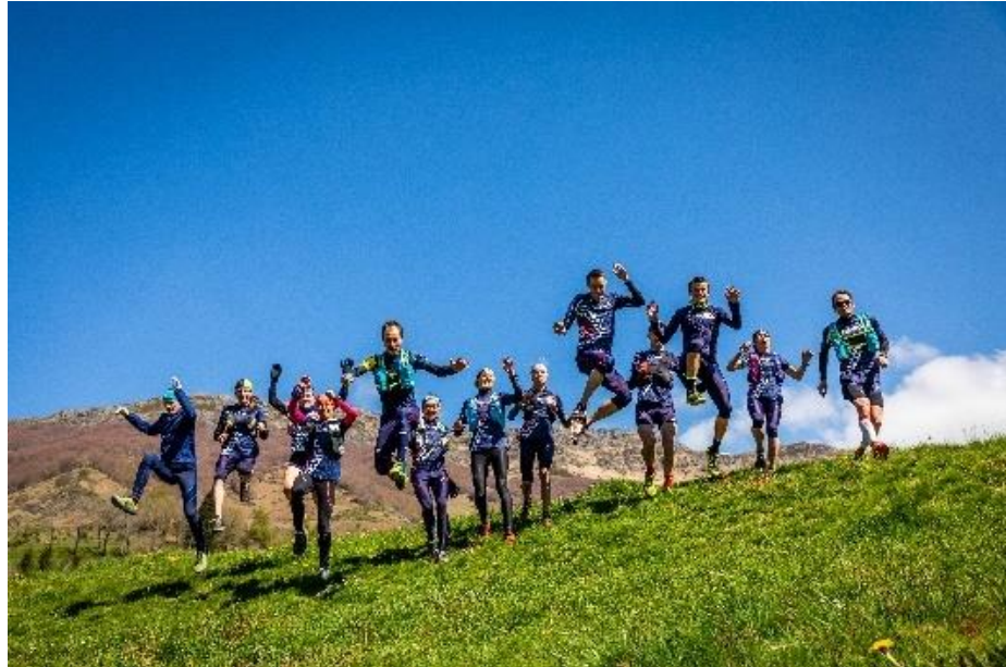
Cantal Destination

Idéalement situé dans l'hexagone, le Cantal est un point de rencontre idéal pour les sportifs de toute la France.