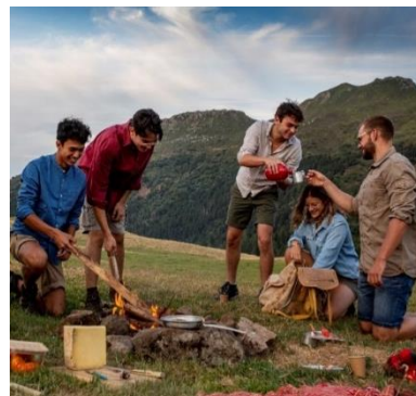
Cantal Destination@Pierre Soissons