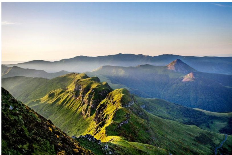
Le Puy Mary Cantal Destination@David Frobert

Il faut avoir gravi le sentier qui mène au sommet du Puy Mary pour se rendre compte de la taille gigantesque du volcan Cantal. En particulier, la crête interrompue par la fameuse brèche de Rolland et les sept vallées glaciaires qui partent en étoile depuis son sommet émerveillent les randonneurs !