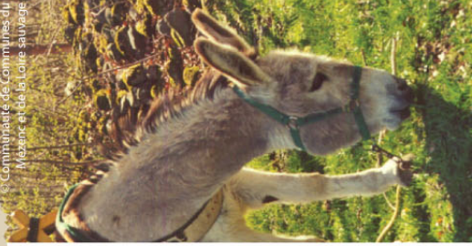
© Communauté de Communes du Mézenc et de la Loire Sauvage

Itinéraire agréé par la Fédération Française de la Randonnée Pédestre