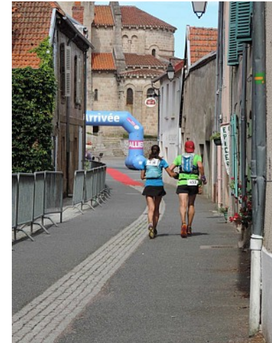
Mairie de Châtel-Montagne