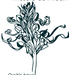
Orchis bouc Himantoglossum hircinum

L' orchis bouc est une orchidée . Son nom fait référence à son odeur , mais rassurez-vous, il faut avoir le nez collé aux fleurs pour percevoir quelques relents, l'odeur est surtout chargée d'attirer les insectes qui assurent sa fécondation, une stratégie dans la production de nectar... Le summum de l'évolution !