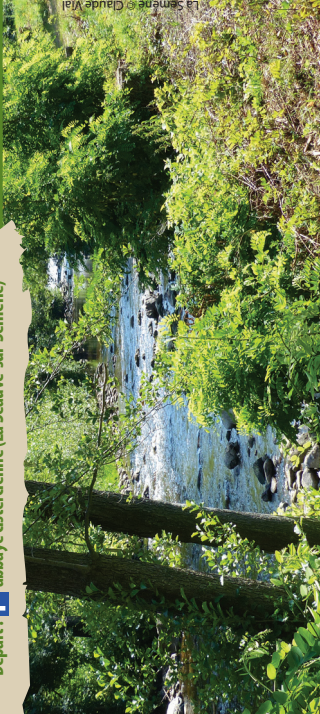
La Semène

Départ : P abbaye cistercienne (La Séauve-sur-Semène)