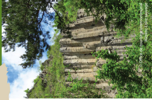
Office de tourisme intercommunal Mézenc-Loire-sauvage

Le site du moulin du Rocher offre une vue rapprochée sur de splendides orgues surmontant un ancien lit de galet. C'est la coulée de lave récente, sortie du cratère incomplet du grand suc de Breyse, qui a cascadié dans le lit du ruisseau de l'Holme et s'est refroidie lentement. Au cours de ce refroidissement, la lave stabilisée a été parcourue par une multitude de fissures de retrait verticales qui ont dessiné des orgues dont l'aspect géométrique saute aux yeux. La plupart des prismes adoptent une section hexagonale. C'est le creusement de la vallée actuelle qui a laissé apparaître l'intérieur de la coulée de lave. Le moulin du Rocher, tout proche, utilisait l'eau dérivée du ruisseau pour entraîner les meules bien utiles pour moudre le grain.