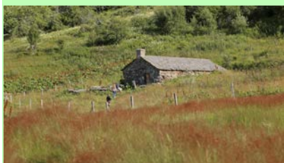
Buron dans la montagne Hervé Vidal