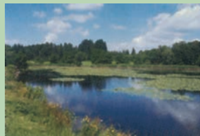
Le lac de Laroche

8 L'itinéraire reprend la piste gravillonnée puis pénètre en forêt par un sentier bordé de remarquables murets, avant de descendre jusqu'à Embort par une piste forestière parfois abrupte et pierreuse. A la sortie du bois, belle vue sur le village et la vallée de la Rhue.