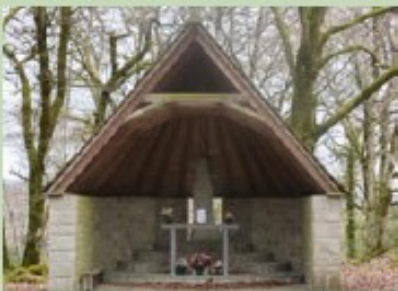
Chapelle du puy de Teldes

Il est possible de relier les PR 26 et 27. Débuter par le PR 26. Au sud du lac quitter le chemin pour rejoindre la route puis continuer sur le PR 27.