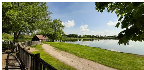
Camping Les Marins

Mis à jour par ... : Office de Tourisme des Combrailles - 15/07/2022 <a onclick="this.href=this.href.replace('LIENCOURANT', encodeURIComponent((location.href.indexOf('file:///') === 0 ? 'rando-savoie-mont-blanc.cirkwi.com/' + location.hash : location.href)));" href="mailto:evelyne.ceroni@tourisme-combrailles.fr?subject=Problème avec une fiche : Camping Les Marins&body=Bonjour,%0D%0A%0D%0ACette demande provient du réseau de diffusion Cirkwi connecté à Apidae. Elle concerne la fiche suivante : LIENCOURANT %0D%0A( fiche https%3A%2F%2Fbase.apidae-tourisme.com%2Fpermalink%2Fconsulter%2Fobjet-touristique%2F884238%2F)%0D%0A%0D%0A Je voulais vous signaler le problème suivant : %0D%0A">Signaler un probleme</a>