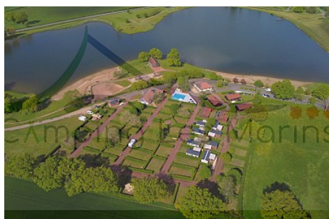
Camping Les Marins