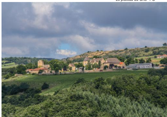
Le plateau du Gris. -PG-

suivre en le traversant plusieurs fois et rejoindre Blesle.