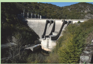
Le barrage de l'Aigle dit de la Résistance

Surplombant les gorges de la Dordogne et l'imposant barrage de l'Aigle, cette randonnée thématique, jalonnée de panneaux et d'observatoires, vous permettra de partir à la découverte du monde des oiseaux.