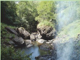
Derrière la cascade

Arrivé dans le petit bourg de Salins, vous pourrez remarquer son église dédiée à Saint Pantaléon et dépendant autrefois de l'Abbaye de la Chaise-Dieu. A noter sur le portail de l'église une représentation sculpturale de la lune et du soleil.