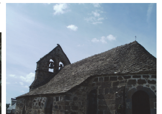
Eglise Saint Pantaléon de Salins (12e, 16e, 18e et 19e siècle)