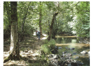
Le calme des berges de l'Auze