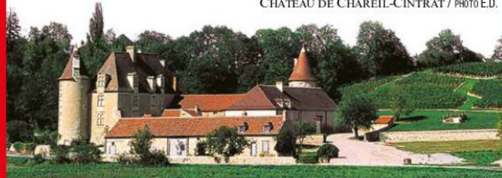
CHÂTEAU DE CHAREIL-CINTRAT

6 Traverser (⚠ > prudence !) et prendre la route en face. Passer devant l'église. Traverser la D 219 et s'engager en face sur le sentier ; il mène sur le côté du château. Suivre la route à gauche pour rejoindre le parking.