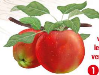
POMMES MELROSE DESSIN PR.

Sur la crête séparant les villages de Chareil-Cintrat et Cesset, le panorama vous offre, d'un côté, une grande plaine qui s'étend vers Saint-Pourçain et, de l'autre, les prémices d'un bocage vallonné vers Fleuriel.