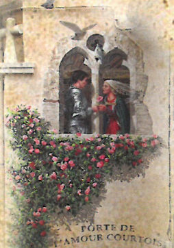
⑥ PORTE DE L'AMOUR COURTOIS