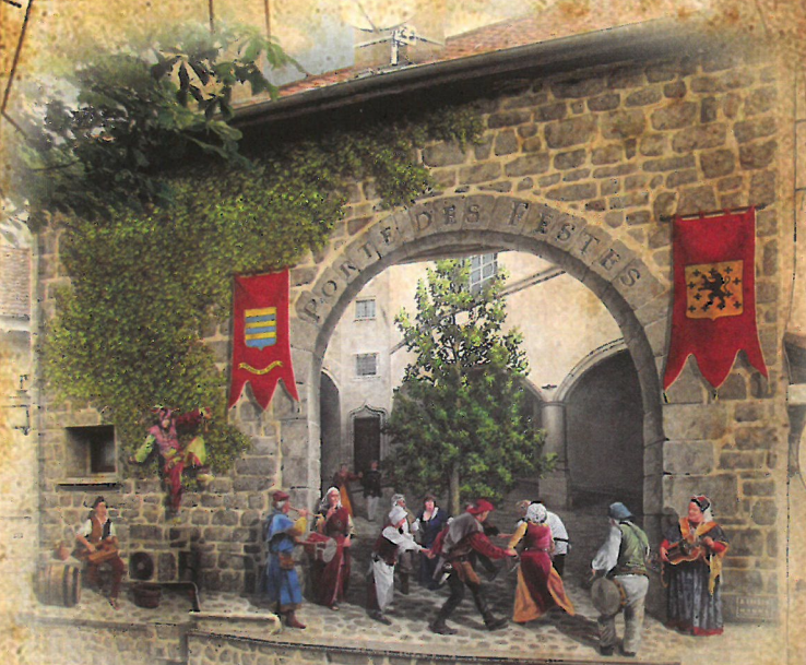
⑧ PORTE DES FESTES