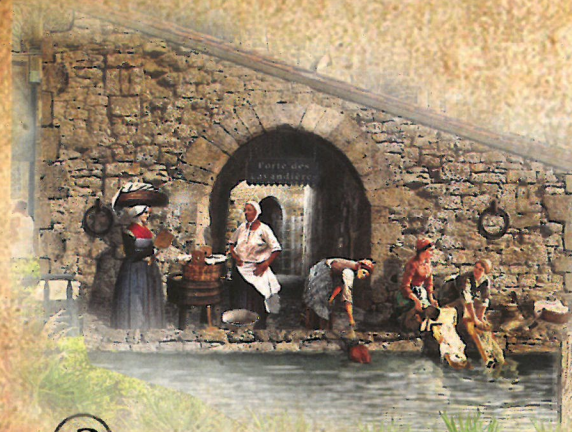
② PORTE DES LAVANDIÈRES