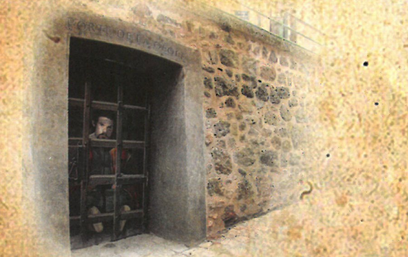
④ PORTE DE LA GEOLE