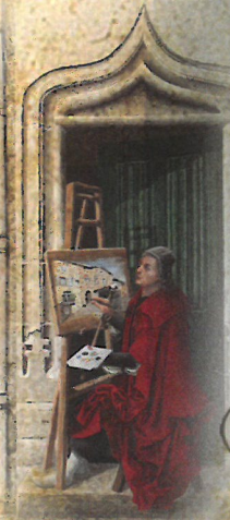
⑦ PORTE DU PEINTRE