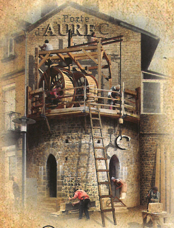
③ PORTE D'AUREC