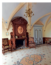
Le salon Henri IV

Visites de groupes réservées de 10 h à 12 h.