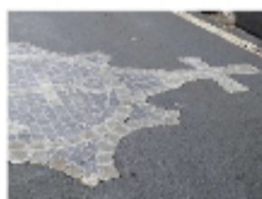
3 - 3/ Mosaïque au sol

Possibilité d'emprunter la rue sous le Pont (1ère à droite), afin de découvrir l'église Sainte-Martine, mélange de style roman en arkose et de style gothique en pierre de Volvic. Construite aux XIIe et XIIIe siècles, elle est dotée d'un bel ensemble de chapiteaux. Retourner rue de la Marine pour poursuivre la balade.