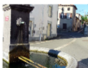
4 - 4/ Place Saint-Nicolas

Au sol, des mosaïques représentant des bateaux et des ancres évoquent le passé de la ville.