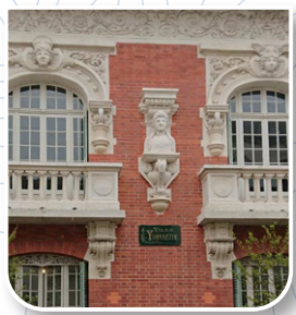
Villa Yvonne (Vichy)

3 Autre prestigieux architecte vichyssois ayant travaillé à Lapalisse, Chanet est à l'origine de bâtiments exceptionnels de la cité thermale (Hôtel de ville, Petit Casino, Notre-Dame-des-Malades). Trouvez le motif décoratif commun entre sa maison vichyssoise et ce bâtiment qu'il éleva à Lapalisse.