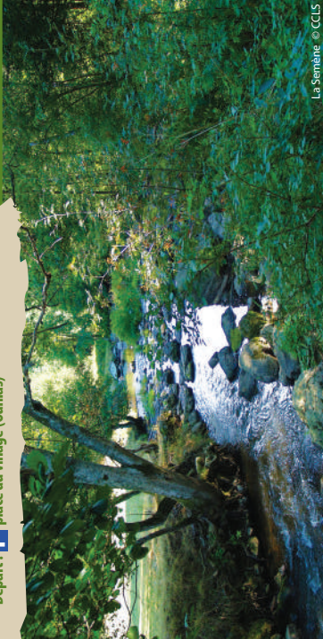
La Semène.

Cet itinéraire vallonné vous permettra de traverser à deux reprises la Semène et de découvrir les petits villages pittoresques de sa vallée. D'Ouillas à la Méane, en passant par Oriol, Lafayette et Creux, c'est tout le riche passé médiéval, artisanal et industriel de la vallée de la Semène que vous pourrez contempler.