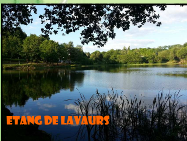
ETANG DE LAVAUERS