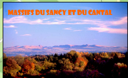
MASSIFS DU SANCY ET DU CANTAL