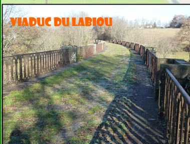
VIADUC DU LABIOU