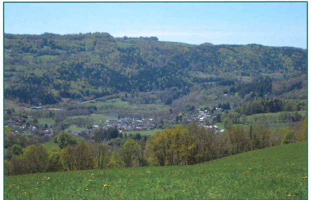
Vue sur Condat

Mais d'autres spécialités s'offrent également aux gourmets : la charcuterie (pâtés, saucissons, jambons, ou la moins connue saucisse de pommes de terre...), la truffade (pommes de terre, lard et tome fraîche), les tripoux (fraise de veau ou de mouton hachée et enveloppée dans un ovale de panse cousu au fil de lin blanc), le pounti (gâteau salé aux herbes, pruneaux et lard), sans oublier la célèbre potée auvergnate.