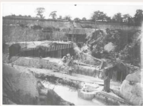
EXPLOITATION DES KAOLINS DES CHAUMES-MOLLES

fram, c'est la géodiversité minéralogique exceptionnelle du massif qui fait aussi sa renommée.