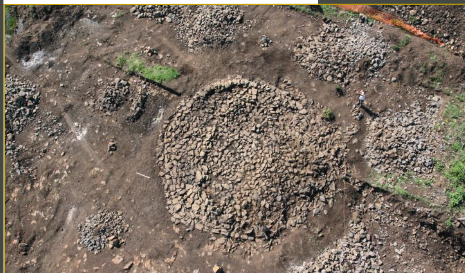
Vue aérienne d'un tumulus sur le plateau d'Espalem.

L'âge des métaux s'étend de l'âge du bronze (environ 2200 av. J.-C.) jusqu'à la Conquête romaine.