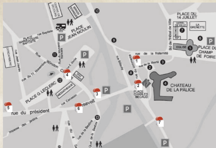
1 circuit découvertes historique de la ville

Nous vous invitons à profiter de la ville et de l'extérieur en vous amusant ! L'activité est réalisée librement, sans animateur. En famille ou entre amis, répondez aux 20 questions qui jalonnent le parcours pédestre 1 en observant notamment l'environnement.