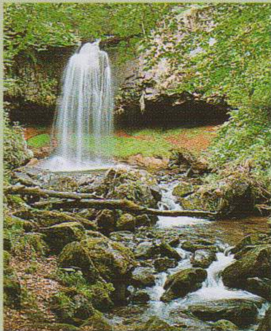
Cascade, la présence de l'eau est constante dans la région