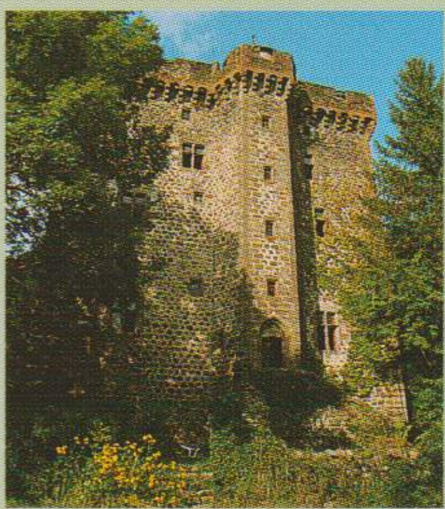
Château de la Boyle, dominant le village de Brezons