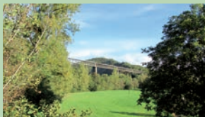
Viaduc de la Sumène (Vendes)

Ce circuit reprend le tracé du PR 24 et offre, malgré quelques portions montantes difficiles, un petit parcours d'initiation à la pratique du Vélo Tout Terrain.