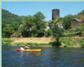
Canoë sur Le Lot

D (GPS : 0456884-4943859 ) Base de canoë-kayak, au lieu-dit Le Port, sur la D 141 en allant de Vieillevie en direction d'Entraygues. Prendre la D 141 en direction de Vieillevie en gardant la base de canoë-kayak sur la gauche. Passer sur un petit pont, puis près des maisons, monter la route