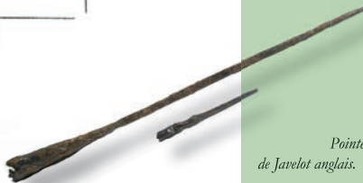
Pointe de Javelot anglais.

Pointe de javelot découverte à la Roche Hubert.